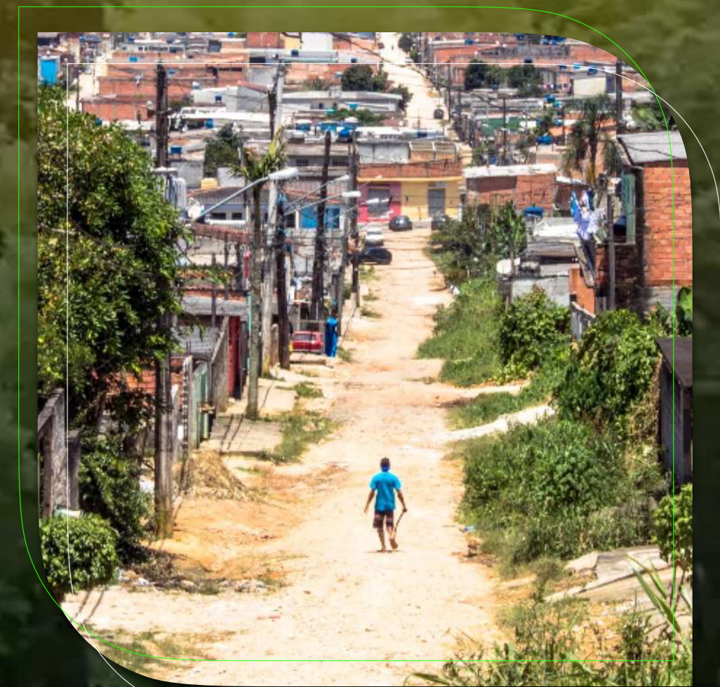
“MAPFRE na Favela”

ALIANÇA DE PROPRIETÁRIOS DE ATIVOS NET ZERO: Redução de 43% de emissões de gases de efeito estufa até 2030